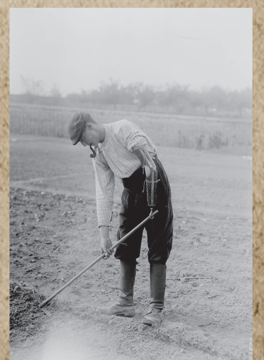
© BNF, département Estampes et photographie, EI-13 (601)

Après quatre années de conflit, l'heure est au recueillement. 22 000 Vendéens sont morts ou disparus. À la souffrance du deuil s'ajoute le retour des hommes blessés et mutilés. Pour eux, la guerre restera inscrite dans leur chair, rendant parfois difficile leur retour à la vie civile.