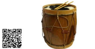
bombo - Argentine ▶