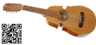
cuatro - Vénézuéla ▶