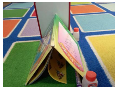
LE TIPI par Lyam