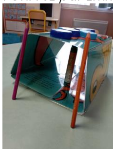
LA CABANE par Rose