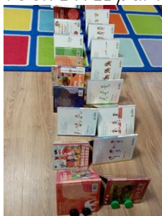
LA CHENILLE par Simon