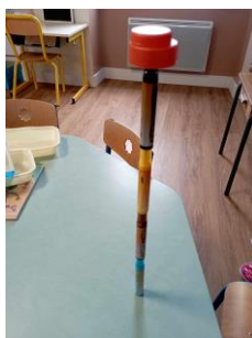
LA TOUR EIFFEL par Mila