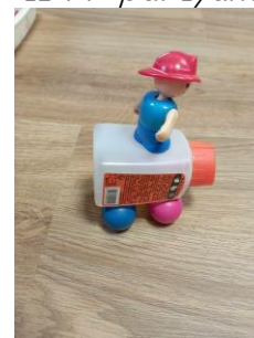
LE CAMION DE POMPIER par Bastien